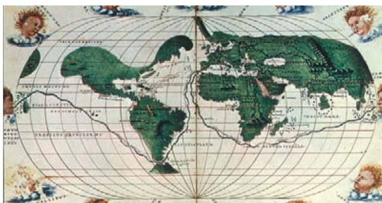
Mapamundi de Battista Agnese, 1543.