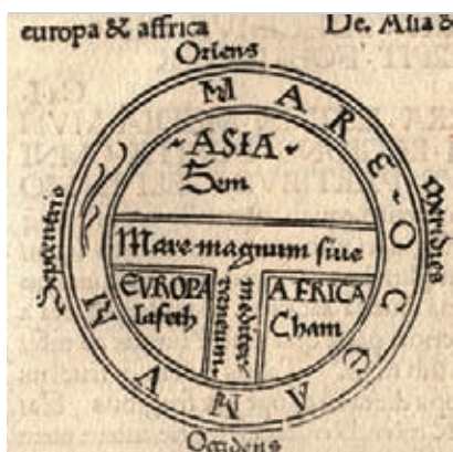
Mapa medieval de tipo T y O.

4 Observa los siguientes mapas y establece las principales diferencias en el cuadro que ves a continuación: