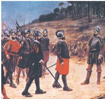
Los "Trece de la fama", soldados que acompañaron a Pizarro en la conquista del Perú.

Los españoles también lograron explorar las zonas ubicadas al sur del actual territorio de los Estados Unidos. Inicialmente, el territorio de la Florida fue recorrido por Juan Ponce de León ; Texas, por Álvar Núñez Cabeza de Vaca y el Gran Cañón del Colorado, por Francisco Vázquez Coronado . Dichas exploraciones también fueron motivadas por la búsqueda de riquezas y oro. Sin embargo, se encontraron con la resistencia de los nativos de la región y con la inexistencia de imperios o grandes pueblos para conquistar.