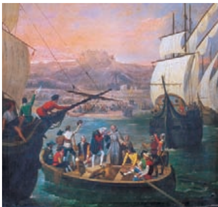
La partida de Palos, suceso que representa el primer viaje de Colón.