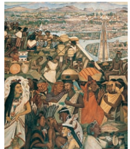
Tenochtitlán, capital del Imperio azteca.

En 1523, la expedición de Cristóbal de Olid se apoderó de la zona sur del país maya, en el actual territorio de Honduras. Allí fundó la villa de Triunfo de la Cruz y se proclamó gobernante de la región. Sin embargo, Olid sostenía serias disputas con Cortés debido a sus ambiciones de conquista, razón por la cual fue capturado, procesado y ejecutado en 1524.