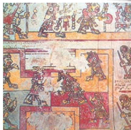
Representación de indígenas aztecas sometidos por los españoles.