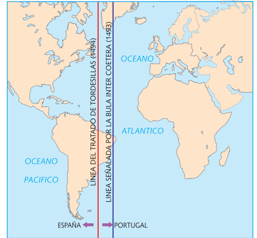
Tratado de Tordesillas.

Las noticias del descubrimiento de una nueva ruta hacia Oriente hicieron reiniciar las disputas entre España y Portugal. Como ambas monarquías eran cristianas, pusieron al tanto de sus diferencias al papa Alejandro VI , quien actuó como mediador. En 1493, el Papa dictó la Bula Inter Caetera , en la cual se estableció un meridiano ubicado a 100 leguas al oeste de las islas de Cabo Verde que dividiría los territorios descubiertos y por descubrir entre la corona de Castilla, al oeste del meridiano, y la corona portuguesa, al oriente de dicha línea. Inconforme, el rey de Portugal, Juan II , logró llegar a un acuerdo con los Reyes Católicos en 1494, fecha en que firmaron el Tratado de Tordesillas , en el que se estipulaba correr el meridiano hasta 370 leguas al oeste de las islas de Cabo Verde.