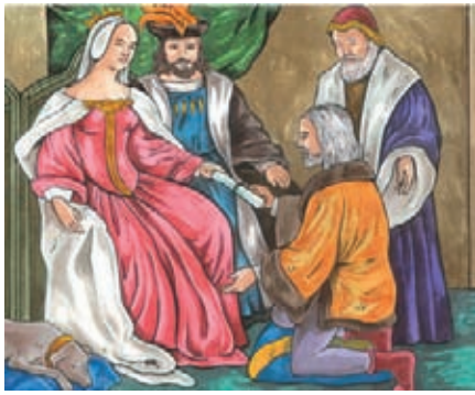
Los Reyes Católicos, protagonistas de la unidad política española.