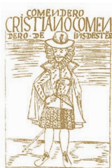
Imagen de un encomendero.