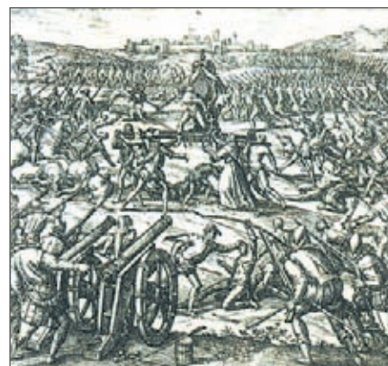
Combate sostenido entre aztecas y españoles.