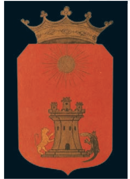
Escudo de armas de Gonzalo Jiménez de Quesada.

Comenzaron, entonces, una serie de negociaciones en las que Jiménez de Quesada intentó aclarar las diferencias con los otros dos conquistadores: Federmán y Belalcázar dejaron en la región cerca de 250 individuos que, unidos a los de Jiménez, iniciaron la colonización del altiplano. Asimismo, los dos conquistadores le cedieron una buena cantidad de animales domésticos y herramientas para consolidar el establecimiento definitivo. Tanto con Federmán, como con Belalcázar, Jiménez llegó al convenio de que la propiedad del nuevo territorio sería establecida por la Corte de Madrid y que los territorios y los indígenas serían repartidos por la Corona. Una vez Jiménez organizó la conquista de los nuevos territorios y dejó un gobierno establecido, en cabeza de su hermano, se marchó con Federmán y Belalcázar a España para adelantar ante la Corte el reconocimiento del territorio que había descubierto. Finalmente, la corte falló a favor de Jiménez de Quesada, otorgándole jurisdicción sobre las nuevas tierras a las que bautizó como Nuevo Reino de Granada . Por su parte, Belalcázar fue nombrado gobernador de las tierras que había conquistado en el occidente, mientras que Federmán no recibió reconocimiento sobre las nuevas tierras.