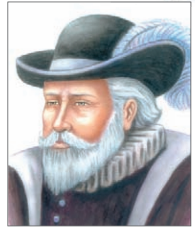
Andrés Díaz Venero de Leyva, primer presidente de la Real Audiencia de Santafé.

Entre las funciones que tenía la Real Audiencia estaban las de servir de tribunales de apelación a sentencias proferidas en primera instancia, realizar nombramientos de funcionarios interinos y vigilar el funcionamiento de las encomiendas.