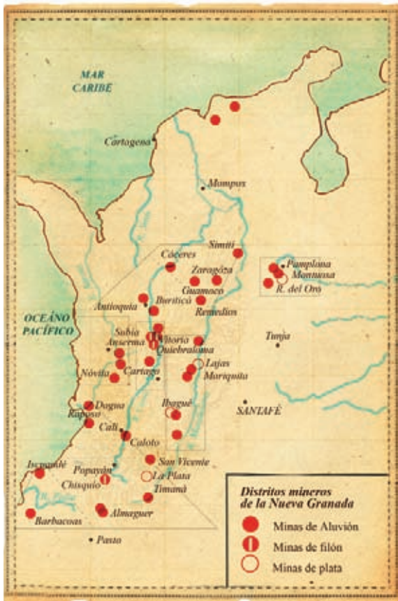
Distritos mineros de la Nueva Granada.

Los Reales de Minas se localizaron al oriente, al centro y al occidente. Al oriente, se encontraban los de Pamplona y Vélez. En el centro, el de Antioquia, Buriticá, Cáceres, Santa Fe, Zaragoza, Remedios y Mariquita. Al occidente, se formó el del río Cauca compuesto por Arma, Anserma y Cartago; las poblaciones de Nóvita y Tadó reunían las explotaciones de Chocó; y Cali y Popayán recogían la producción de la costa del Pacífico.