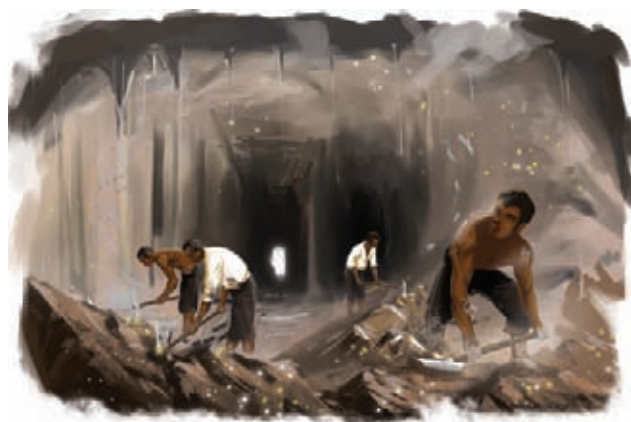
Explotación minera de veta.