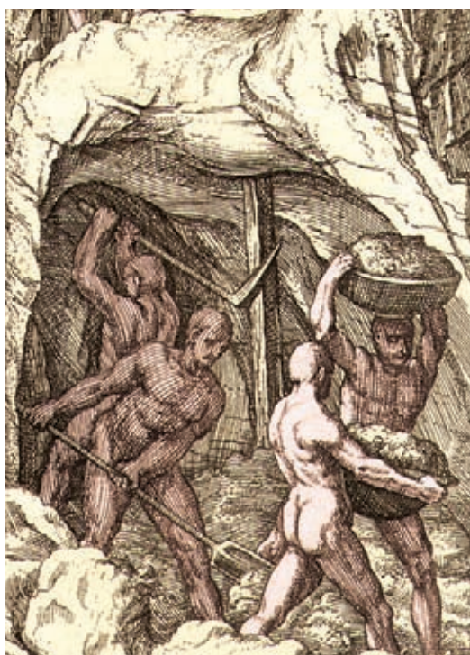
Esclavos trabajando en una mina de oro.

■ Segundo ciclo. Se inició hacia el año 1680 y finalizó a principios del siglo XIX. Los lugares de explotación de este ciclo fueron las provincias del Chocó y el distrito antioqueño. En contraste con el primer ciclo, en este nuevo período la extracción del oro se realizó con mano de obra esclava negra. Este ciclo se caracterizó por la proliferación de pequeños empresarios que llevaban a cabo actividades paralelas a la minería, como el comercio y la venta de insumos. Además, se logró una mejor integración entre las haciendas y minas, al contrario de lo que había ocurrido en el primero.