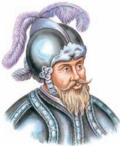
Rodrigo de Bastidas.

En 1509, Ojeda retornó a los territorios entregados en capitulación a Bastidas, y recorrió la costa atlántica hacia el occidente. En el golfo de Urabá, fundó el pueblo de San Sebastián de Urabá , el cual duró poco tiempo por causa de la hostilidad de los indígenas. En 1510, fundó Santa María la Antigua del Darién , poblado que sirvió de punto de partida para expediciones que se dirigieron hacia el interior. Esta etapa culminó con la expedición de Vasco Núñez de Balboa , que descubrió el océano Pacífico en 1513.