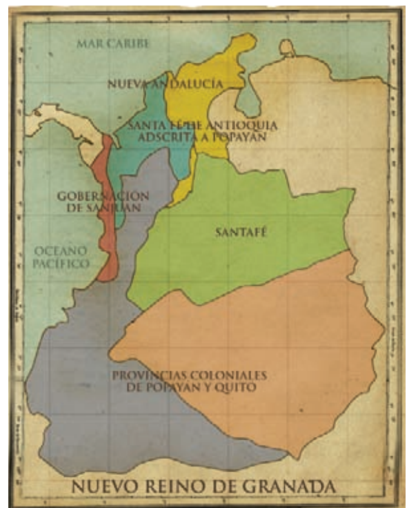
Ubicación de la Real Audiencia de Santafé en el Nuevo Reino de Granada.