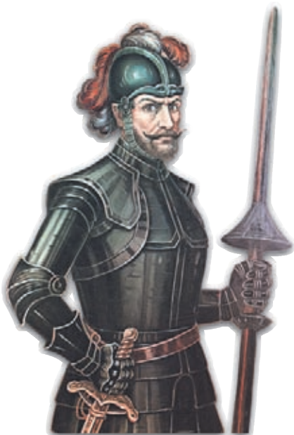
Sebastián de Belalcázar.

A comienzos de 1539, Belalcázar llegó a las costas del río Cauca, arribó al altiplano Cundiboyacense, donde se encontró con las tropas de Jiménez de Quesada. Este mismo año, Jorge Robledo , militar de las huestes de Belalcázar, fundó las ciudades de Cartago y Anserma .