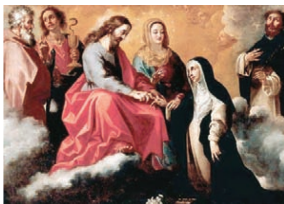
Desposorios de Santa Catalina, obra de Gregorio Vásquez de Arce y Ceballos.

En la literatura colonial se destacaron los relatos de los cronistas. Juan de Castellanos quien narró la conquista de la Nueva Granada a través de la obra Elegías de varones ilustres de indias . Por su parte, Juan Rodríguez Freile describió la sociedad de Tunja y Santa Fe en su obra El Carnero . Además, se destacan Afectos espirituales , escrita por la madre Josefa del Castillo y la Historia General del Nuevo Reino de Granada de la autoría de Lucas Fernández de Piedrahita.