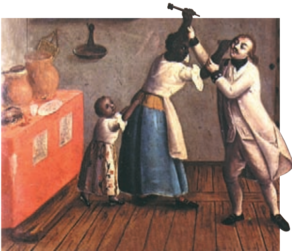
Los malos tratos a los que fueron sometidos los esclavos, propició su levantamiento en contra de los españoles.