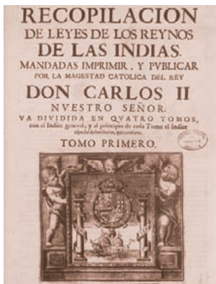
Las Leyes Nuevas, 1542.

Durante la Colonia, el actual territorio colombiano recibió el nombre de Nueva Granada y comprendía las gobernaciones o provincias de Cartagena, Santa Marta, Popayán, la Nueva Granada, Antioquia y los Llanos Orientales. Con el tiempo, estos territorios conformaron parte de la jurisdicción de la Real Audiencia de Santa Fe.