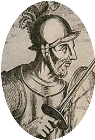
Alonso de Ojeda.