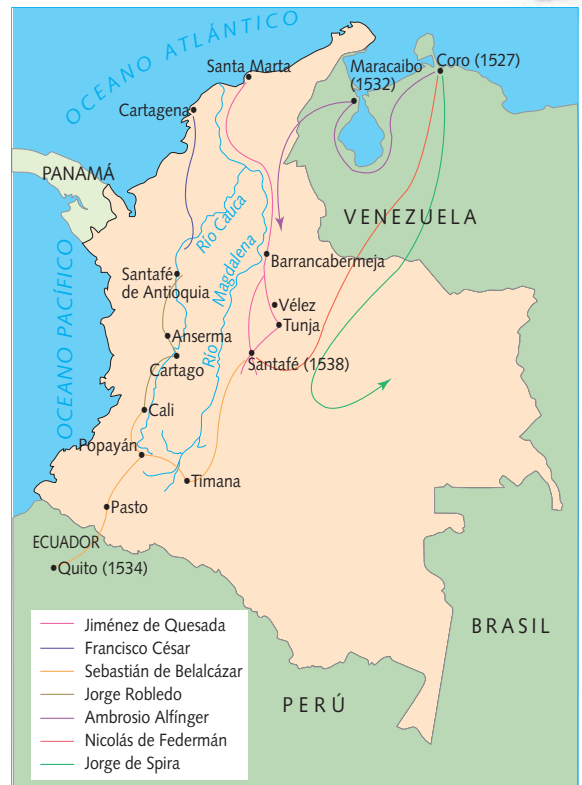
Rutas de los conquistadores en Colombia.

En 1522, Pascual de Andagoya llegó hasta la desembocadura del río San Juan. Asimismo, entre 1524 y 1525, Francisco Pizarro y Diego de Almagro realizaron dos viajes que las llevaron hasta las costas del actual del departamento del Cauca. En este último año, una expedición comandada por Bartolomé Ruiz , exploró las costas de Ecuador y el actual departamento de Nariño. Finalmente, para 1526, Pizarro llegó a las costas de Perú, mientras que sus hombres comenzaron la exploración del sur del actual territorio colombiano.