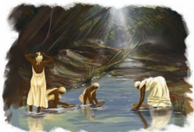
Explotación minera de aluvión.

3 Observa las siguientes imágenes y completa el cuadro con la información requerida.