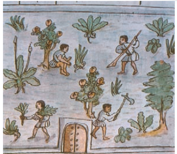
Representación de indígenas trabajando en una plantación.

La actividad de los comerciantes del interior del Nuevo Reino de Granada permitía a diferentes zonas alejadas integrarse a los circuitos comerciales. Se destacaban dos tipos de comerciantes: los mercaderes de carrera , que efectuaban el comercio a grandes distancias y tenía contactos en España y los puertos granadinos, y los tratantes , que compraban mercancías a los mercaderes de carrera y eran especialistas en el comercio a escala regional y local.