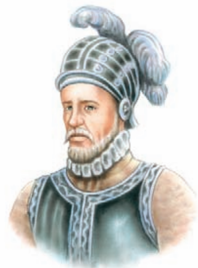
Pedro de Heredia.