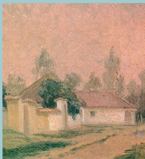
Pintura de una hacienda colonial de la sabana de Bogotá.