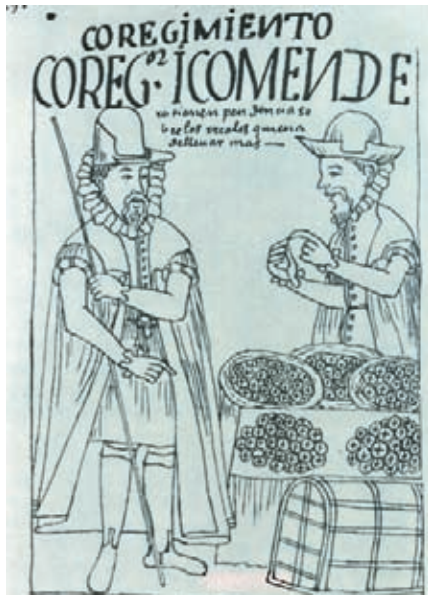
Corregidor español, funcionario encargado de representar a la Corona en el gobierno de las colonias.