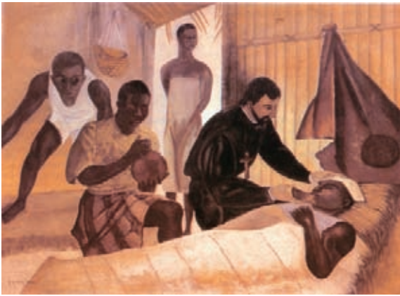
Pedro Claver, misionero jesuita que se preocupó por la situación de los esclavos negros en Cartagena.