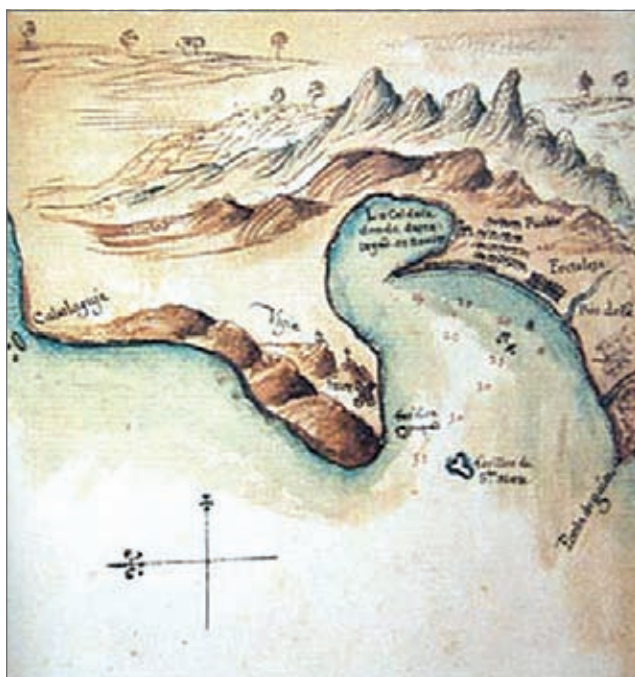
Mapa de la ciudad de Santa Marta, siglo XVI.