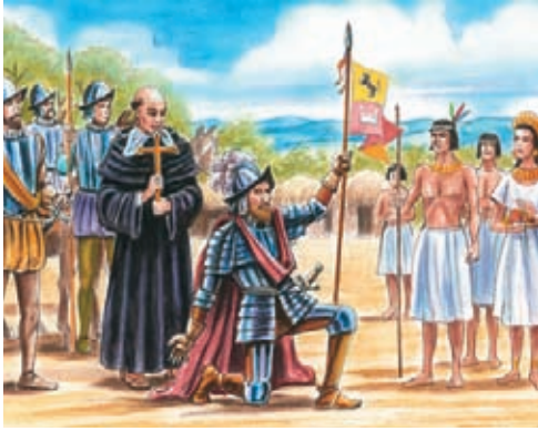
Representación de la fundación de Bogotá.