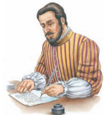
Gonzalo Jiménez de Quesada.