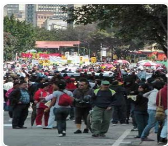
Marcha Democrática, 1° de Mayo, Bogotá 2011.

2- LEE, RECORTA Y PEGA LAS IMÁGENES O COPIA Y DIBUJA