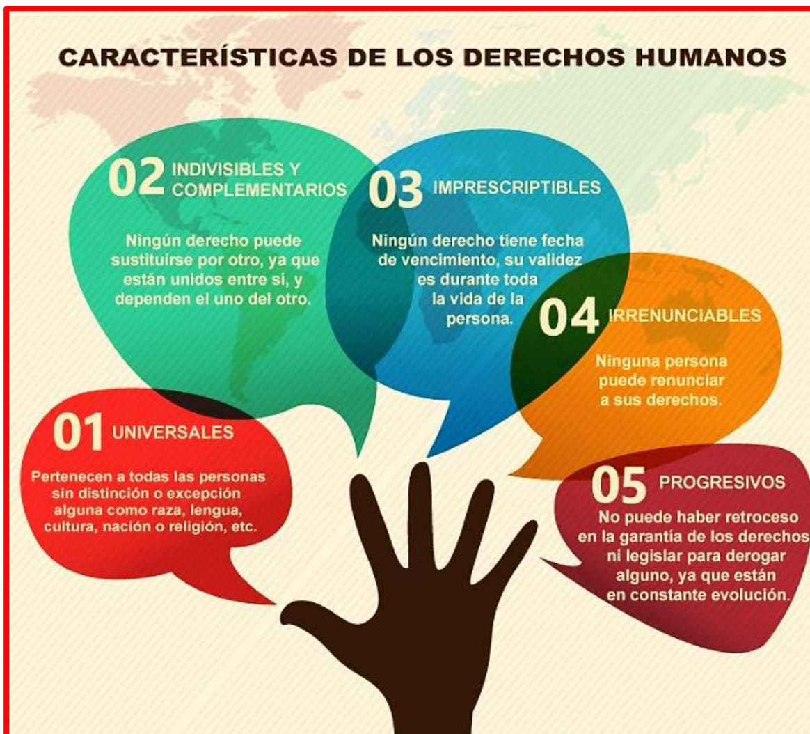
Derechos Humanos - YouTube

Los "Derechos Humanos", son conquistas de la persona humana, conquistas del hombre y la mujer logradas durante toda la historia de la Humanidad, que nos dignifican cada vez más como seres humanos. Llamamos atributos a las características propias de los seres humanos. Necesidades propias que corresponden a las personas por ser personas.