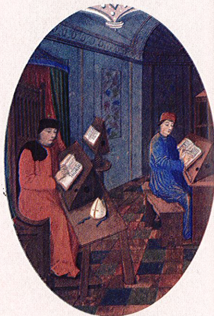
Monjes copistas. Miniatura del siglo XII