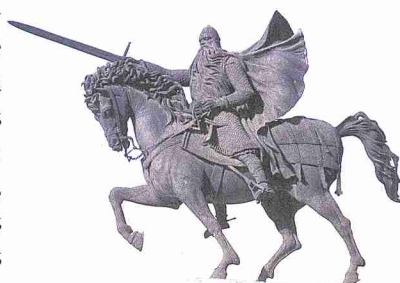
Estatua ecuestre del Cid Campeador, Rodrigo Díaz de Vivar.

Los yernos del Cid son acusados de cobardía, porque huyen de un león. Para desquitarse, azotan a sus esposas y las abandonan en un pinar en Corpes. Al final, la ofensa es vengada y ellas contraen nuevas nupcias con los infantes de Navarra y de Aragón.