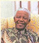
Nelson Mandela, líder político sudafricano.