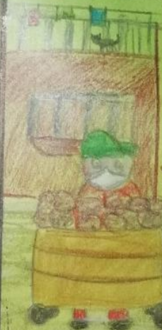
Vendedor de Flores