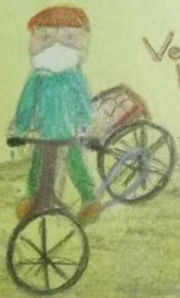
Vendedor de huevos