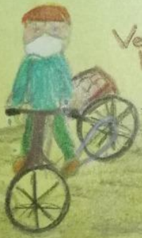
Vendedor de huevos