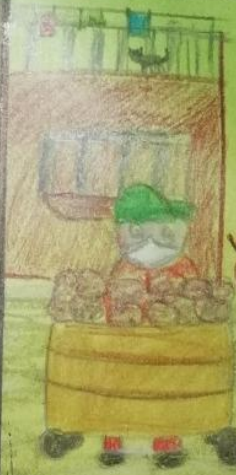
Vendedor de Flores